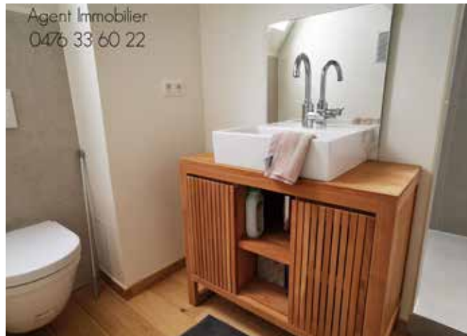
Agent Immobilier 0476 33 60 22